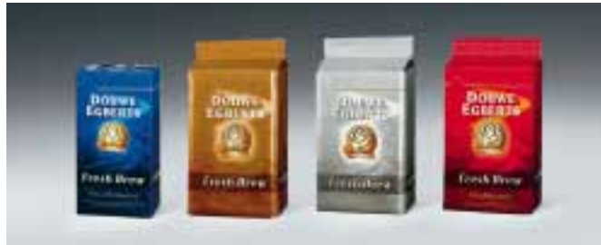
Röstkaffee bester Provenienzen sorgt für echte Geschmackserlebnisse.

Ob in der Gastronomie, in Krankenhäusern, in Altenheimen, oder in der Gemeinschaftsverpflegung.