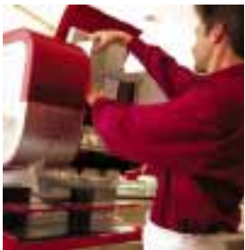
Das Café-Pak System: Aromatischer, leichter und hygienischer können Sie Kaffeegenuss kaum anbieten.