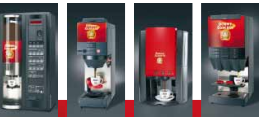
Innovative Technik, leichte Handhabung und Wartung für Ihre beste Tasse Kaffee.

Damit Ihre Kaffeever-sorgung allen Kriterien standhält: Hohe Qualität, innovative Technik, umfassende Beratung und Service für Ihre beste Tasse Kaffee. Denn wenn Ihre Kunden genießen, profitieren Sie.